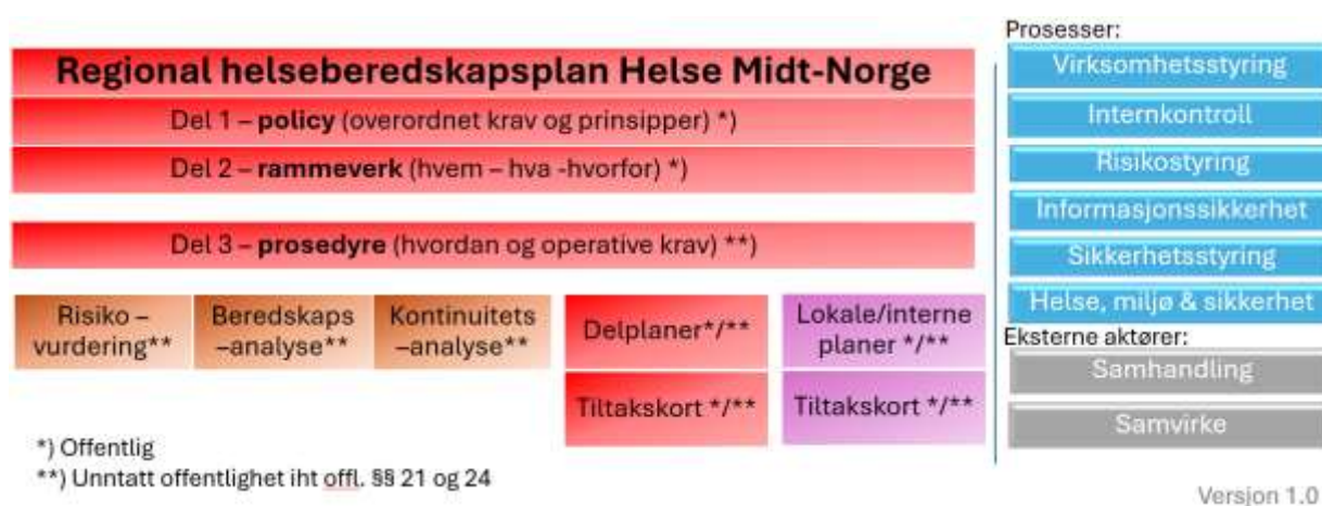
Figur 1: Sammenheng internt i regional helseberedskapsplanverk og relasjon til andre prosesser.

Helseberedskapsarbeidet er en integrert del av virksomhetsstyringen og øvrig arbeid med internkontroll, risikostyring, informasjonssikkerhet, sikkerhetsstyring og HMS. Policyen utgjør del 1 av Regional helseberedskapsplan.